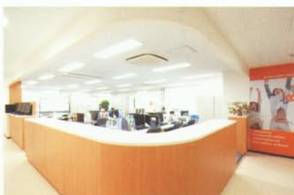
ดูการ สามารถติดต่อกับเจ้าหน้าที่ของทางโรงเรียนได้ตลอดเวลา