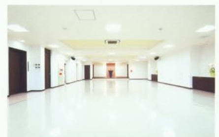
ห้องประชุมใหญ่ ใช้ในงานพิธีต่างๆ ของทางโรงเรียน เช่น พิธีเข้าเรียน หรือ พิธีจบการศึกษา เป็นต้น