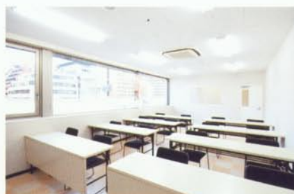
ห้องเรียน มีห้องเรียนขนาดใหญ่เอีกรวมกันทั้งสิ้น 16 ห้อง